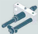
Zestaw ESP 1