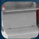
2 pojemniki na odpady