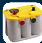
Akumulator i ładowarka