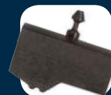
Szczęki do przewodów hamulcowych i klimatyzacyjnych