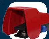
Elektryczny pedał sterujący**