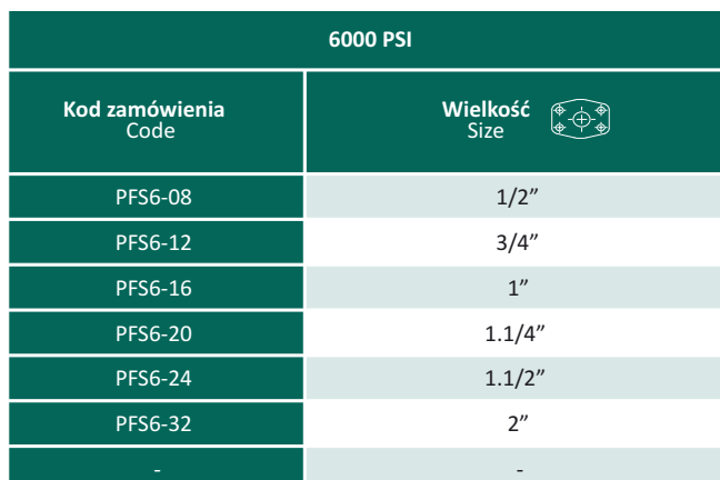
Zaśleпки do przyłączy flanszowych SAE 3000 PSI i SAE 6000 PSI SAE Flanges 3000 PSI and 6000 PSI Plugs

Zaśleпки do przyłączy flanszowych SAE 6000 PSI SAE Flanges 6000 PSI Plugs