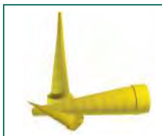
Zaśleпки Yelloc® do elementów złącznych oraz przewodów hydraulicznych Plugs Yelloc® for adaptors and hydraulic hose assemblies